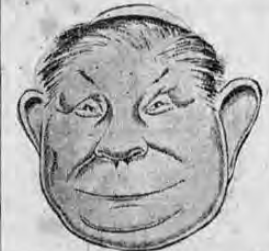
MONSEÑOR PASCUAL DIAZ