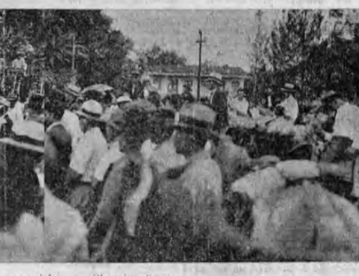
El Dr. Calderón Guardia dirigiéndose a la multitud en Sabanilla de Montes de Oca.