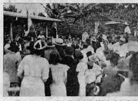
Instantánea cuando el Lic. don León Cortés pronunciaba su vibrante discurso.

Cerca de las nueve de la mañana se inició la marcha hacia "Los Yoses", lugar de reunión con los amigos de Montes de Oca.